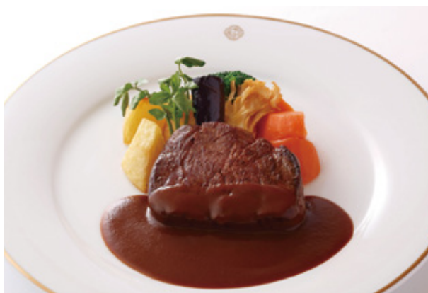
牛フィレ肉のステーキ