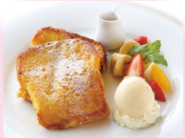
スイーツフレンチトースト 「プレーン」