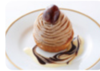
モンブラン (アルコール使用)