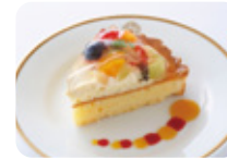
タルト フリュイ (アルコール使用)