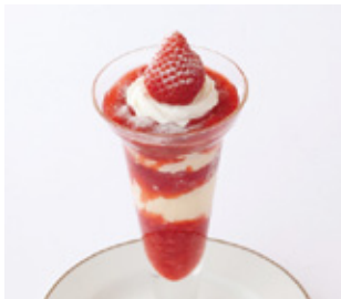
ストロベリーパフェ Strawberry Parfait