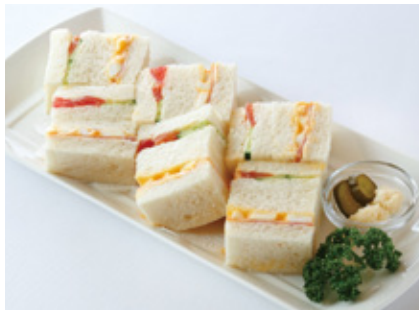
ミックスサンドウィッチ (ハム・玉子・トマト・キュウリ) Mixed Sandwich (Ham・Egg・Tomato・Cucumber)

コーヒーまたは紅茶またはハーブティー付 with Coffee or Tea or Herbal Tea