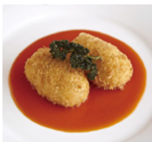
ミートクロケット 資生堂スタイル Meat Croquettes "SHISEIDO" Style