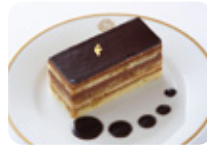
オペラ (アルコール使用)