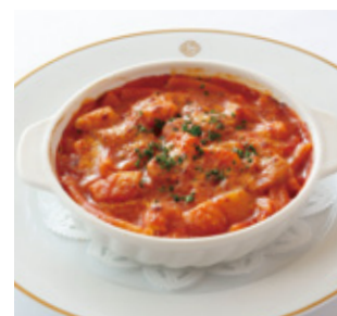
シーフードマカロニグラタン トマトソース Seafood and Tomato Macaroni Gratin