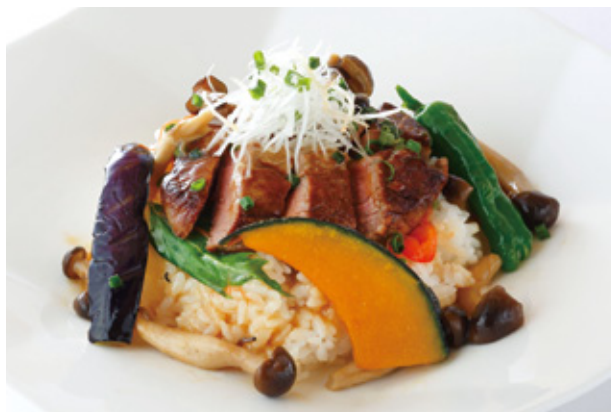
牛フィレ肉のステーキ丼