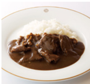
ビーフカレーライス Beef Curry and Rice