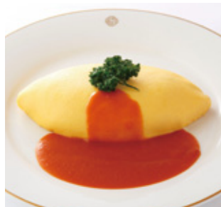
オムライス Omelette Rice