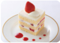
ガトーフリーズ (アルコール使用)