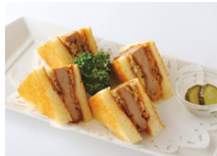
ポークフィレカツサンドウィッチ Filet of Pork Cutlet Sandwich

コーヒーまたは紅茶またはハーブティー付 with Coffee or Tea or Herbal Tea