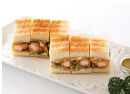
シュリンプフライサンドウィッチ Fried Shrimp Sandwich