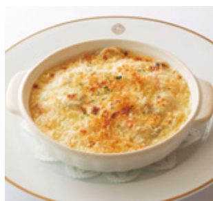
小海老と マッシュルームのドリア Shrimp and Mushroom Doria