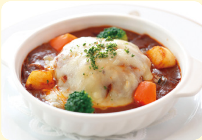
煮込みハンバーグ