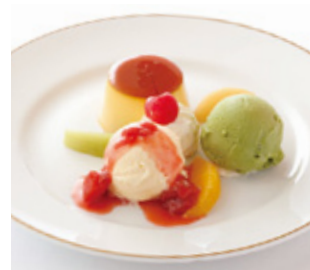
プリン・アラ・モード Pudding "Ala mode"