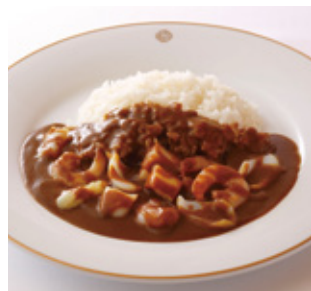
シーフードカレーライス Seafood Curry and Rice