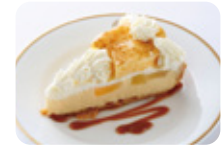
りんごのシブースト