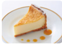
伝統のチーズケーキ