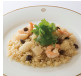
シーフード和風ピラフ Seafood Pilaff Japanese Style