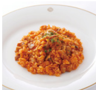
チキンライス Chicken Rice