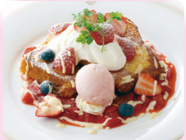
スイーツフレンチトースト 「ストロベリー」