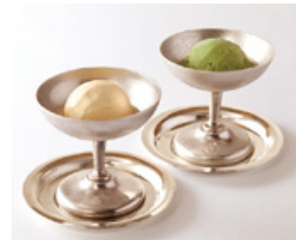
アイスクリーム(バニラまたは抹茶) /シャーベット

Ice Cream (Vanilla or Green Tea) /Sharbet