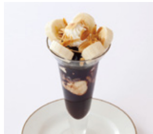
チョコレートパフェ Chocolate Parfait