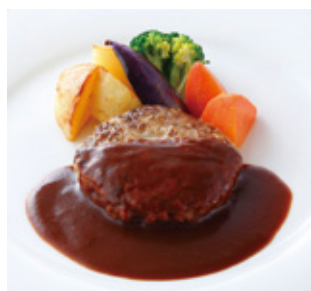
ハンバーグステーキ デミグラスソースまたは和風ソース Hamburger steak Demiglass Sauce or Japanese Sauce