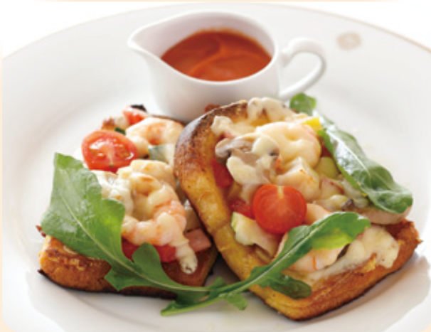
野菜とシーフードの フレンチトースト ピッツア仕立て トマトソース添え