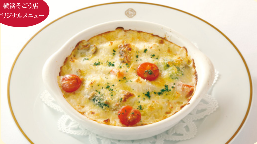
根菜とずわい蟹のドリア