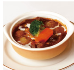
ビーフシチュー Beef Stew パンまたはライス付 with Bread or Rice