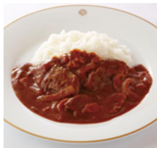
ハヤシライス Hashed Beef and Rice