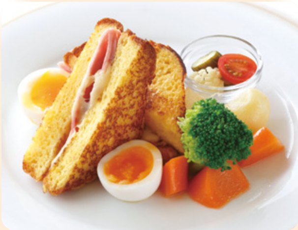
ミールフレンチトースト 「クロックマダム」